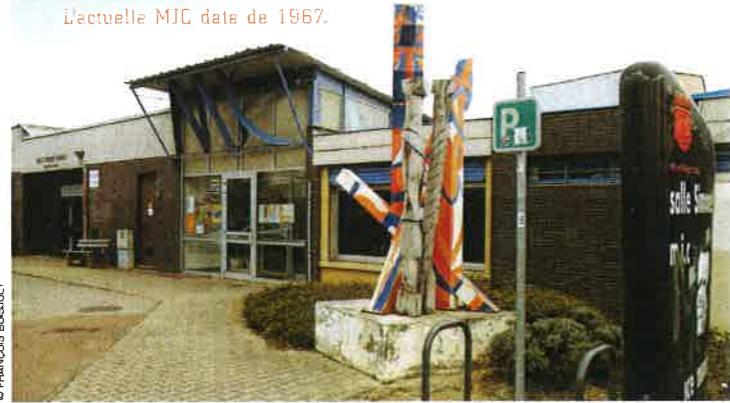
L'actuelle MJC date de 1967.

Construite en 1967, la MJC Ô Totem s'est agrandie et modifiée au fil des années. Désormais vétustes, les locaux ne sont plus adaptés aux actuelles fonctionnalités d'une maison des jeunes et de la culture. Entre la réfection de la toiture et des façades, la mise en conformité électrique et le renforcement de l'isolation, les travaux de rénovation auraient été trop onéreux. C'est pourquoi, un équipement de 790 m 2 est aujourd'hui en cours de construction, pour un coût total de 1 566 000 euros. La nouvelle MJC répondra aux besoins des adhérents : organisation de spectacles et concerts, enregistrements studio, répétitions musicales,